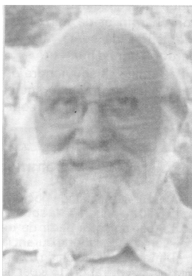
Image de Dieu venu nomader avec toute l'humanité, tu nous as fait comprendre que nous sommes tous des gens du voyage en quête de Dieu.

Durant de longues années, tu as conduit tant de jeunes au-delà de leurs horizons pour qu'ils se découvrent, se retrouvent au plus profond d'eux-mêmes dans leur soif d'absolu.